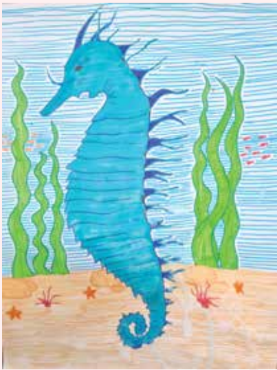
Petra Špinjača, 6. a