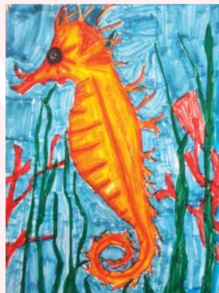
Filip Vukičević, 6. a