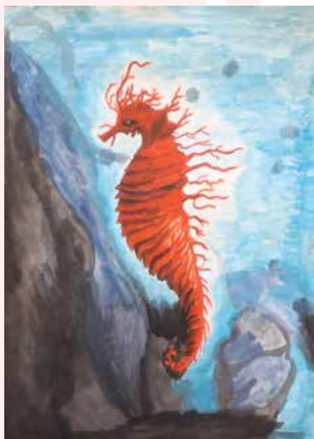
Bianka Vrcić, 7. a