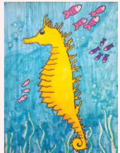
Tonka Todorović, 6. a